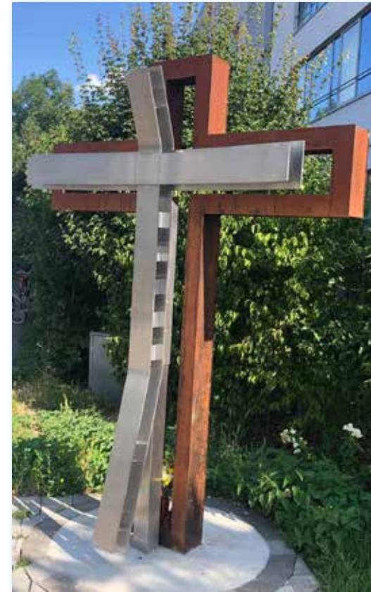
Wegkreuz am Dormagener Bahnhof

In Zeiten politischer Bedrängnis hatte der politische Witz Konjunktur und gab die Mächtigen-Großen ihrer Lächerlichkeit preis. Sollten wir in Zeiten der Bedrängnis durch Krieg und Lebenskrisen da nicht Witze über den Tod und das Sterben machen?