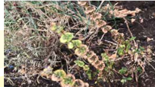
2018: Extreme Trockenheit zerstört Felder

Erntedank ist der Tag im Kirchenjahr, an dem wir ganz bewusst dafür danken. Das Fest hat jedoch keinen biblischen Ursprung. Doch wir Christinnen und Christen sehen die Schöpfung als Gottes Geschenk an. So führen wir auch Teile der Schöpfung wie Saat und Ernte auf Gott zurück und wissen uns zu Dank verpflichtet.