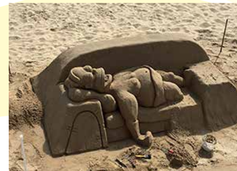
Auch die Simpsons machen Urlaub!

Vielleicht liegt es daran, dass wir in dieser Zeit die Gelegenheit nutzen, Dinge zu ordnen, sei es um uns herum oder auch in uns drin. Ich komme dazu, manches länger und in