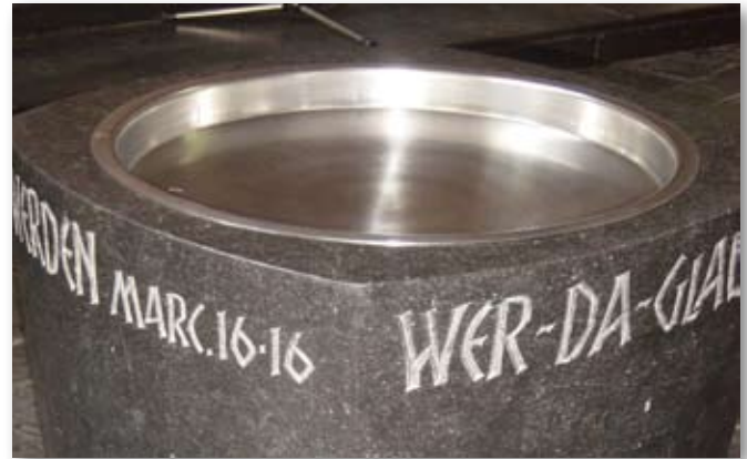
Taufbecken in der Christuskirche

Die Taufe stiftet Gemeinschaft. Sie knüpft nicht nur ein Band zwischen dem Täufling und Gott, sondern auch ein Band zwischen dem Täufling und der Gemeinde. Glaube braucht solche Gemeinschaft. Und in dieser Gemeinschaft der Heiligen, wie sie das Glaubensbe-