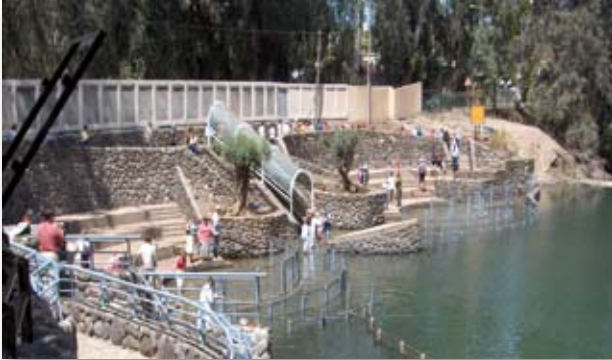
Taufstelle am Jordan: Hier wurde Jesus von Johannes getauft

Dennoch ist dann auch das Verstehen als nächster Schritt wichtig. Die Taufe ist einerseits ein göttliches Geheimnis, das mit verständlichen Worten nahegebracht werden muss. Deshalb noch ein weiterer Schritt: Weitertragen. Das bedeutet auch Hilfe und Zusage an die Eltern und auch für die Getauften selbst.