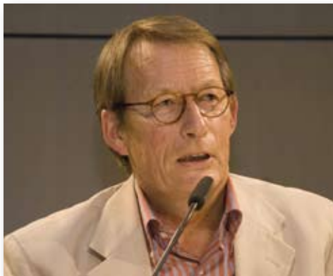
F.C. Delius ist im Jahr 2009 mit dem Evangelischen Buchpreis susgezeichnet worden

Rom, am einem sonnigen Tag im Januar 1943. Eine junge Deutsche, 21 Jahre alt, die kurz vor der Geburt ihres ersten Kindes steht, begibt sich auf einen Spaziergang durch die ihr fremde Stadt. Ihr Mann, mit dem sie zusammenzuleben