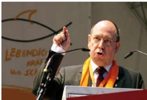
Präses Nikolaus Schneider 2007 auf dem Kölner Kirchentag

771 Evangelische Kirchengemeinden bilden die EKiR. Sie arbeiten in 39 Kirchenkreisen zusammen.