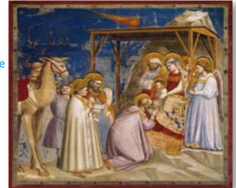
Anbetung durch die weisen Sterne

Die Astronauten sind den Sternen näher als die Menschen auf der Erde. Aber auch sie finden keine naturwissenschaftliche Erklärung für den Stern von Bethlehem oder Weihnachtsstern, der den Weisen aus dem Morgenland als Wegweiser gedient haben soll.