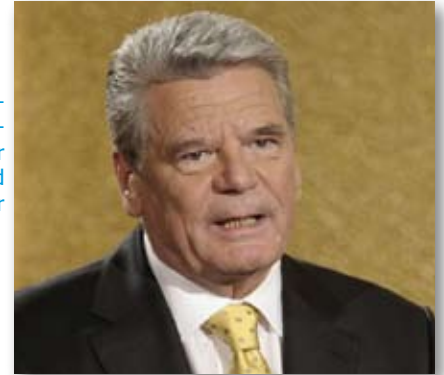
Erst im dritten Wahlgang zum Bundespräsidenten unterlegen: Der Rostocker Pfarrer und DDR-Bürgerrechtler Joachim Gauck

Joachim Gauck hat seine Erinnerungen "Winter im Sommer - Frühling im Herbst" aufgeschrieben, in denen er die traumatisierende Erfahrung der Unfreiheit und das beglückende Erlebnis der Freiheit beschreibt, aber auch den schwierigen Übergang von erzwungener Ohnmacht zu einem selbstbestimmten Leben nachzeichnet.