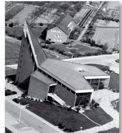
Luftaufnahme der Christus- kirche aus den 1960er Jahren

Das Geschäftsprinzip ähnelt dem einer Genossenschaft: Interessierte können sich am Projekt beteiligen und so am Betrieb der Anlage teilhaben. Die Kirchengemeinde fungiert als Dachgeberin und ist ebenfalls Mitglied in einer Gesellschaft bürgerlichen Rechts, die dann die Anlage betreibt.