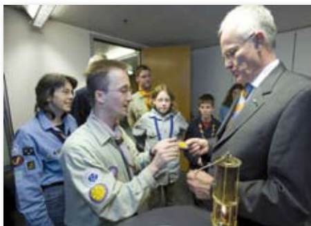
Auch Ministerpräsident Rüttgers erhält das Friedenslicht in Düsseldorf

An Weihnachten wird das Licht in vielen Häusern und Kirchen brennen. Pfadfinderinnen und Pfadfinder tragen es in die Familien, in Kirchengemeinden, Krankenhäuser und Schulen, in Verbände, öffentliche Einrichtungen und zu Menschen, die im Mittelpunkt des gesellschaftlichen Lebens und am Rande stehen. Auch die Dormagener Pfadis holen das Licht in unsere Stadt.