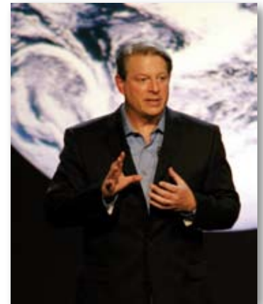
Al Gore möchte nicht nur die Amerikaner sensibilisieren und zu neuem Handeln ermuntern

In den vergangenen Jahren wurde zu Beginn des neuen Jahres in der Christuskirche ein Segnungs- und Salbungsgottesdienst gefeiert. Die Salbung ist ein uraltes Ritual der Kirche: Christus ist der Gesalbte und so auch die Christen. Der Gottesdienst beginnt am Sonntag, den 4. Januar um 18:00 Uhr.