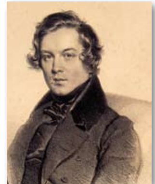
Robert Schumann: Geboren am 08. Juni 1810 in Zwickau, früh verstorben am 29. Juli 1856 in Endenich bei Bonn