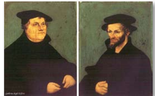
Luther über Melanchthon: „In meinem ganzen Lehramt achte ich nichts höher als den Rat Philipps“

Luther, der Prophet unter den Reformatoren, arbeitete unermüdlich an der neuen Theologie - nur fehlte ihm dabei oft die Systematik. Daher schrieb Melanchthon 1521 die erste gültige Zusammenfassung der reformatorischen Lehre, die „Loci Communes“. Luther war so begeistert von diesem Buch, daß er es gar in die Bibel aufnehmen wollte.