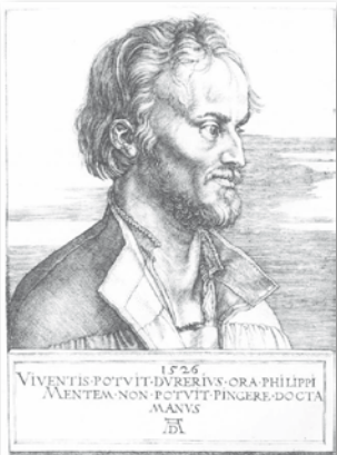
Philipp Melanchthon, der „Lehrer Deutschlands“, 1526 von Albrecht Dürer porträtiert

Melanchthon war ein Sprachwissenschaftler und Theologe. Er war als Reformator neben Martin Luther eine treibende Kraft der deutschen und europäischen Reformation und wird auch wegen seiner Verdienste um die Entwicklung des Schulwesens „Praeceptor Germaniae“ genannt.