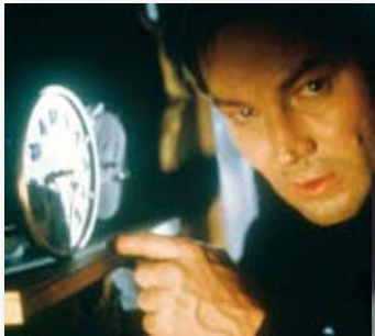
Klaus-Maria Brandauer als Hitler-Attentäter Georg Elser

Am Donnerstag, den 25. März, steht das gescheiterte Hitler-Attentat im Münchner Bürgerbräu-Keller 1939 im Mittelpunkt des Films " Georg Elser-Einer aus Deutschland ".