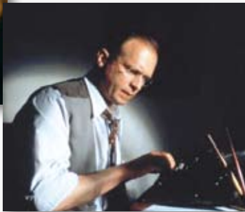
Ulrich Tukur spielt Dietrich Bonhoeffer

Am Donnerstag, den 29. April wird der vielfach ausgezeichnete Film " Dietrich Bonhoeffer-Die letzte Stufe " mit Ulrich Tukur gezeigt.