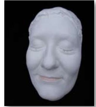
Lebendmaske als „Selbstportrait“

die dann auch bis zum Ende des Monats in der Kirche zu sehen sein werden.