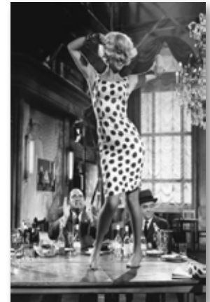
Lilo Pulver tanzt auf dem Tisch... und Moskau ist begeistert!

Sie erzählt von den Jugendlichen am kürzeren Ende dieser geteilten Straße in Ost-Berlin: Von der Liebe und von dem Glück, eine Original-Platte der Rolling Stones zu ergattern. Und über allem wacht die Volkspolizei!