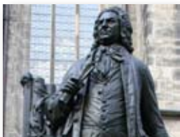
Auch er fing an der Orgel mal klein an: Johann Sebastian Bach

Orgelspielen kann eigentlich jeder lernen, der zwei Hände und zwei Füße hat. Wer schon Klavier oder Keyboard gespielt hat, hat es natürlich am einfachsten, aber man kann auch direkt ohne Vorkenntnisse an der Orgel anfangen.